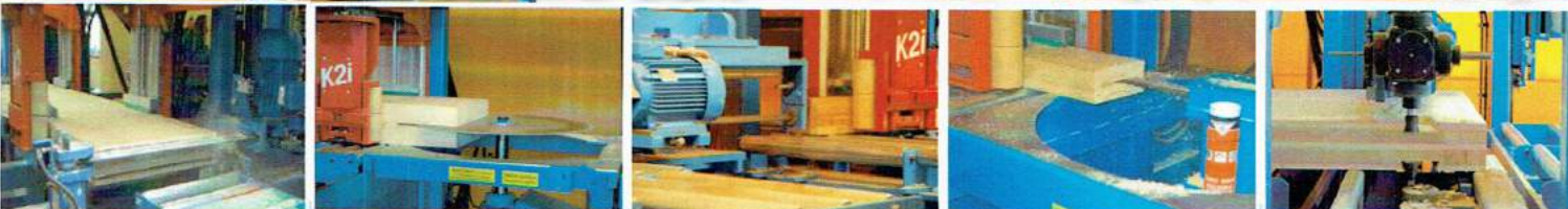
大断面チェーンソー